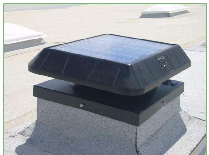
SUNRISE 15 Watts

Los peores enemigos de sus cubiertas y áticos son la temperatura y las humedades. ¿Usted es consciente del problema? Su cubierta funciona como un gran radiador gigante y gran parte de la temperatura es transmitida al interior de los espacios habitables, incrementando considerablemente la temperatura de éstos. El coste que implica el refrigerar su vivienda y los saltos térmicos que afectan a su cubierta (Ejemplo "grietas"). En los días de bonanza, incluso cuando el aire acondicionado no es necesario, con SUNRISE continuará circulando el aire fresco, creando un ambiente más confortable en su vivienda o lugar de trabajo.